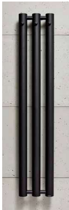
ROSENDAL R70/3B czerni