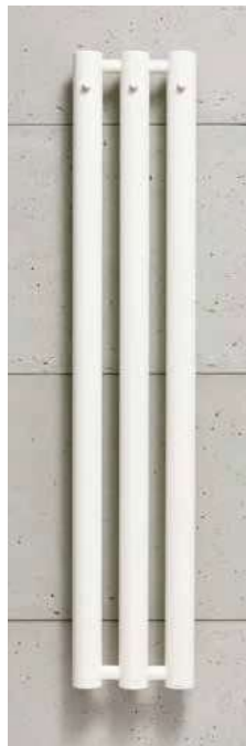
ROSENDAL R70/3W biały