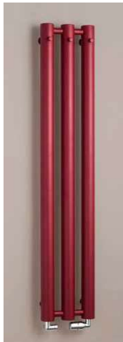
ROSENDAL R70/3RE bordo (kolor strukturalny)