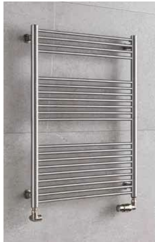
TAIFUN TS1C – chrom 500 × 790 mm